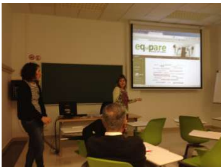
Integrantes de Equipare s.coop. durante su presentación

El día 5 de diciembre de 2014, tuvieron lugar dos seminarios prácticos impartidos por Grupo Emaús Fundación Social y Reas-Euskadi, con la colaboración de la cooperativa EQUIPARE.