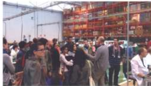
Alumnos del Máster visitando GUREAN (Centro Especial de Empleo)

Modo semipresencial para ofrecer flexibilidad a todo el alumnado, realice o no una actividad profesional. Esta